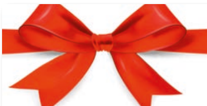
Geschenkhüllen-Nr.: GS 12 Menge: _____