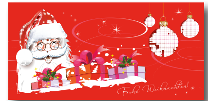
Geschenkhüllen-Nr.: GS 05 Menge: _____