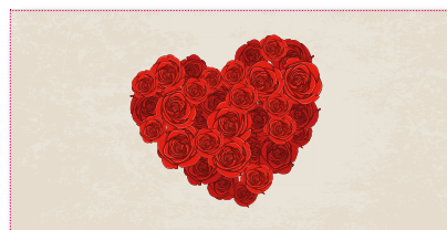
Geschenkhüllen-Nr.: GS 07 Menge: _____