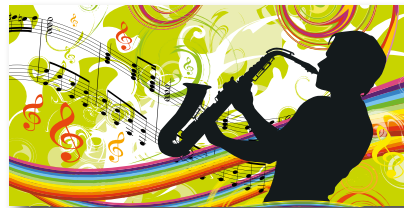
Geschenkhüllen-Nr.: GS 04.2 Menge: _____