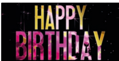
Geschenkhüllen-Nr.: GS 09 Menge: _____