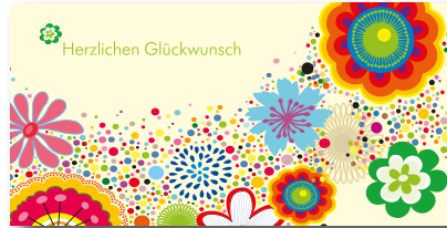
Geschenkhüllen-Nr.: GS 02 Menge: _____