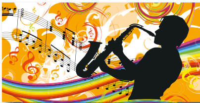
Geschenkhüllen-Nr.: GS 04.1 Menge: _____