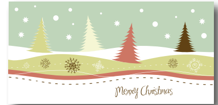
Geschenkhüllen-Nr.: GS 03 Menge: _____