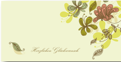
Geschenkhüllen-Nr.: GS 01 Menge: _____